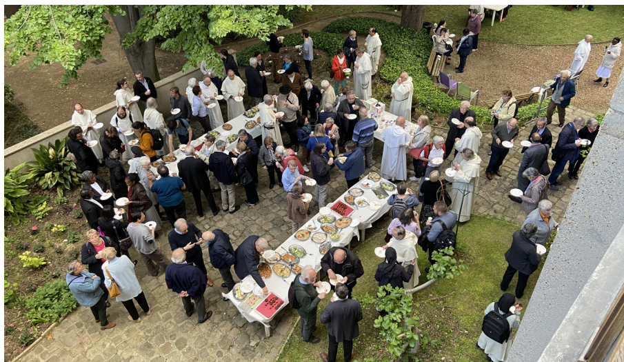
La fête de la saint Dominique, dite de printemps, le 24 mai dernier